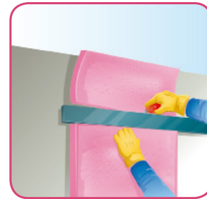
Corte el material excedente con una navaja o cuchillo con filo.