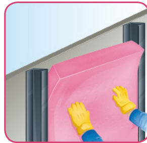
Presione hacia la cavidad.

Una vez que se fijan al muro o al techo las tiras de madera, el Aishlogar se coloca en los espacios libres entre bastidores. Tenga el cuidado de verificar que terminado de instalar el Aishlogar quede bien en contacto con el techo, el piso y los postes laterales. Encima de todo el conjunto y si la diferencia entre la temperatura exterior a interior llegara a ser muy alta (como en zonas de climas extremos), convendrá colocar una barrera de vapor (si el producto no cuenta con una). Esta barrera puede ser de Kraft Asfaltado. Posteriormente, y sobre la barrera de vapor, se procederá a colocar el tipo de acabado que se desee, pudiendo ser un lambrin de madera o un panel de yeso. En el caso del panel de yeso podrá adquirir papel tapiz o el acabado de su preferencia.